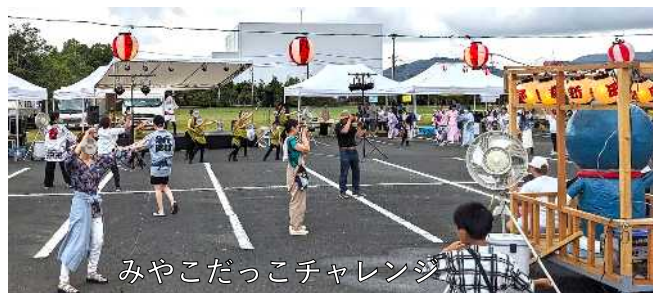
みやこだっこチャレンジ