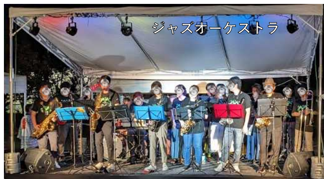
ジャズオーケストラ