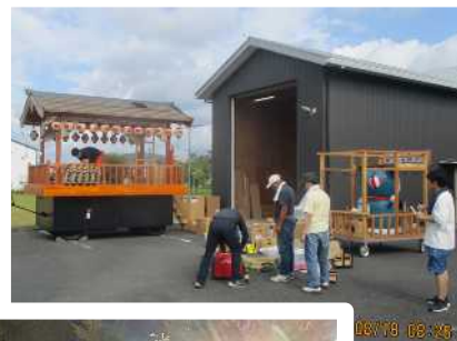
子ども屋台の準備作業