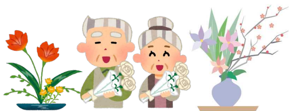
令和5年4月1日現在 新都田地区の人口（浜松市ホームページによる）

新都田地区の敬老祝賀会の対象者は、2丁目131人、3丁目66人、5丁目150人の合計347人（令和5年5月末現在）で、対象者は年々増加する傾向にあります。