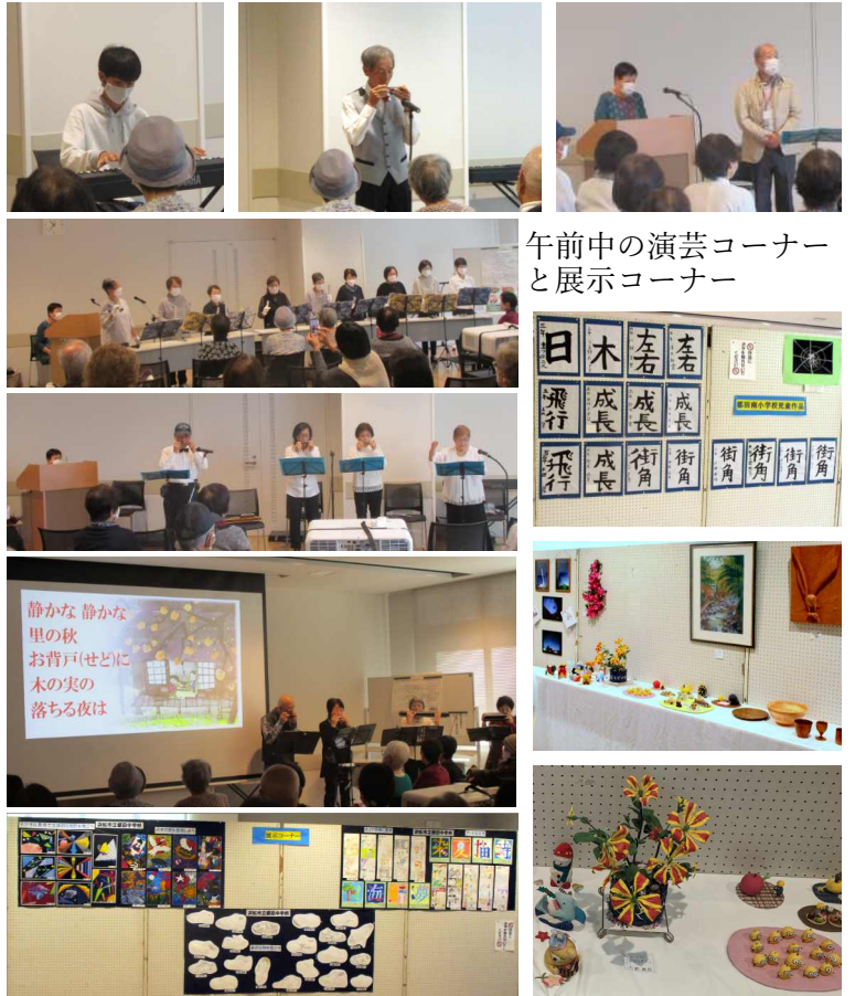
午前中の演芸コーナーと展示コーナー

参加者は、新都田地区の住民が600人弱、地区外の住民を加えると700人程度でした。